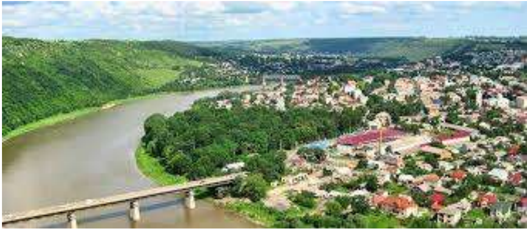
мал. 2.4. Річка Дністер місто Заліщики

Річка Нічлава відноситься до малих річок, є водним об'єктом господарсько-побутового призначення. Стік ріки (у верхній течії Нічлава) формується на території області. Забруднення спостерігається по всій течії річки. На якість вод особливо впливають зворотні води міста Борщів, де відсутні очисні споруди. Завдяки каскаду ставків на території міста, де відбувається самоочищення води, вплив міста зменшується. В нижній течії річка має високий вміст сульфатів, чим суттєво відрізняється від інших рік регіону.