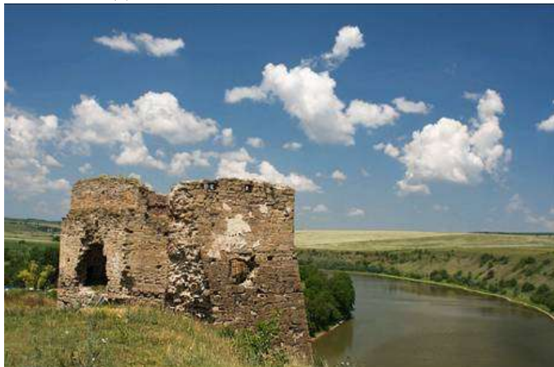
мал.2.5. Річка Збруч

Контроль за станом р. Збруч проводився 16 травня 2018 року Тернопільським обласним управлінням водних ресурсів у створі, який знаходиться в смт Скала-Подільська.