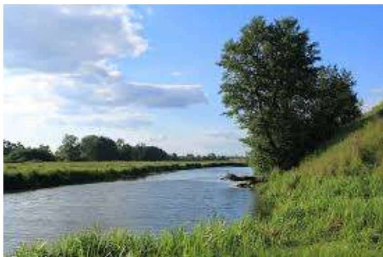
Мал. 2.7. Річка Іква

Контроль за станом р. Іква проводився 23 травня 2018 року Тернопільським обласним управлінням водних ресурсів у створі, який знаходиться в м. Кременець та 23 травня 2018 року Тернопільським обласним управлінням водних ресурсів у створі, який знаходиться на межі з Рівненською областю у с.Андруга Білокриницької сільської ради Кременецького району.