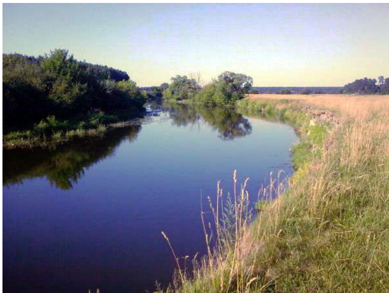
Мал. 2.6.Річка Горинь

по показнику хімічного споживання кисню ( 15,68 \text{ мгО/дм}^3 при ГДК 15,0 \text{ мгО/дм}^3 ), біологічного споживання кисню ( 2,96 \text{ мгО/дм}^3 при ГДК 2,25 \text{ мгО/дм}^3 ), марганцю ( 0,05 \text{ мг/дм}^3 при ГДК 0,01 \text{ мг/дм}^3 ) (для водних об'єктів рибогосподарського призначення). Збільшення хімічного та біологічного споживання кисню свідчить про органічне забруднення. Збільшення вмісту марганцю у воді може призвести до ураження капілярів, що негативно впливає на гідробіоту та здоров'я людини.