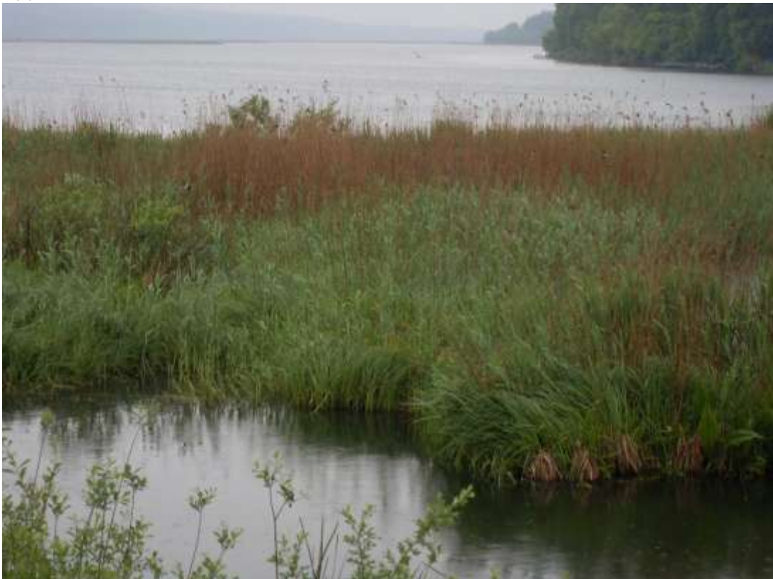
Мал.2.2 Івачівське водосховище

Контроль за станом р. Серет Івачівського водосховища протягом травня не проводився.