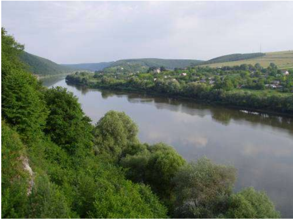
Мал. 2.3. Касперівське водосховище на річці Серет

Контроль за станом р. Серет в районі Касперівського водосховища проводився 15 травня 2018 року Тернопільським обласним управлінням водних ресурсів у створі в с. Касперівці 6 км (Касперівське водосховище).