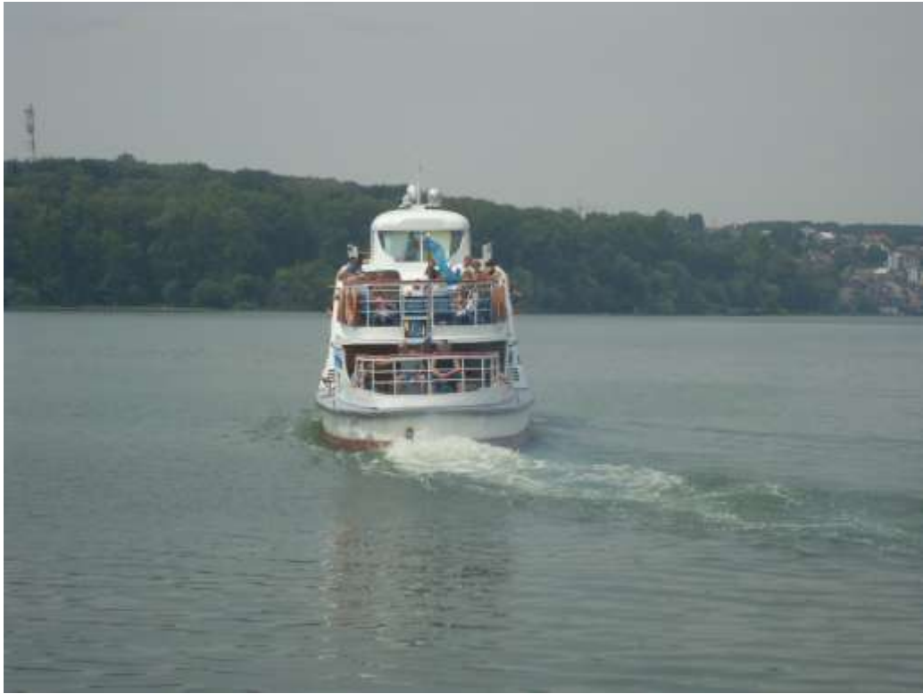
Мал. 2.1. Тернопільський став

Івачівське водосховище р. Серет відноситься до категорії господарсько-побутового призначення.