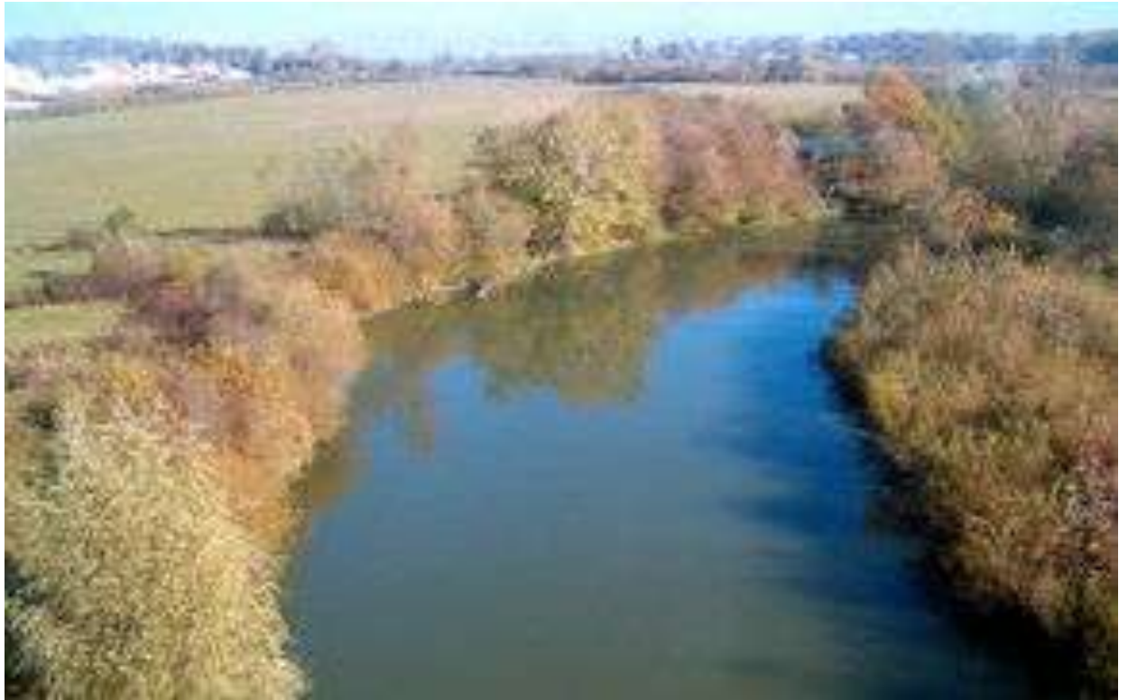
Мал. 2.5.Річка Горинь

Контроль за станом р. Горинь протягом листопада не проводився.