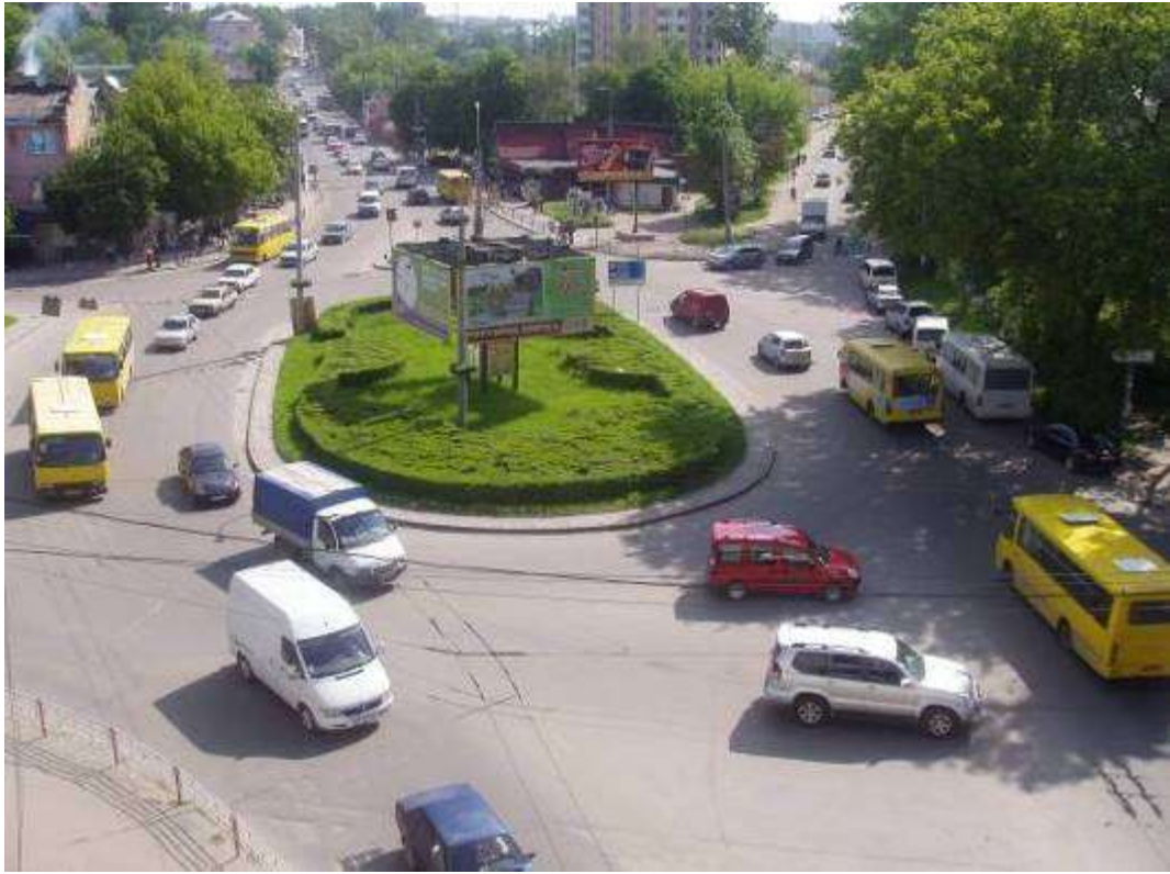
Транспортна розв'язка вулиць Збараської, Бродівської, Галицької у м. Тернопіль (стаціонарний пост спостереження за станом атмосферного повітря № 1)