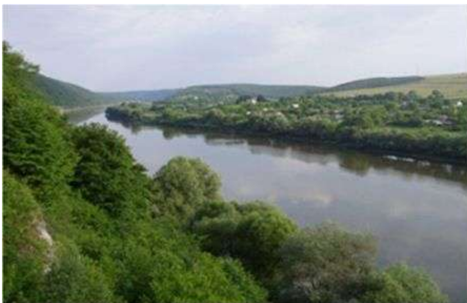
Мал.2.3. Касперівське водосховище на річці Серет

Контроль за станом р. Серет в районі Касперівського водосховища протягом листопада не проводився.