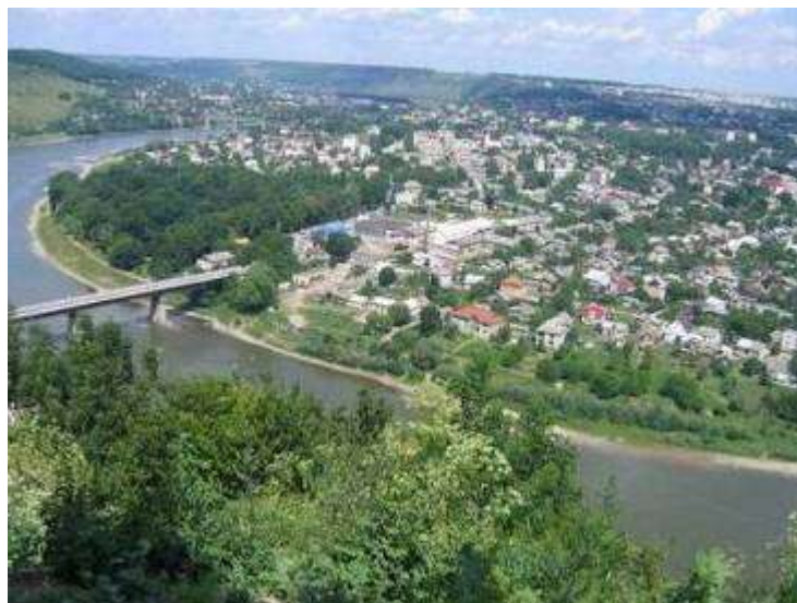
Річка Дністер місто Заліщики

Річка Дністер є другою за розмірами рікою України і головною водною артерією Молдови. Ріка починається в Карпатах на висоті 760 м над рівнем моря недалеко від села Вовче Турківського району Львівської області і тече спочатку на північ, а далі на південний схід через Західну Україну, Поділля. І вже недалеко від Одеси впадає у Чорне море, а точніше у Дністровський лиман. Традиційно Дністер поділяється на такі три частини: верхній (від витоків до гирла Золотої Липи), середній (від гирла Золотої Липи до гирла Реута недалеко від Дубоссар) і нижній (від гирла Реута до Дністровського лиману). Загальна довжина річки – 1352 км, площа водозабору – 72100м 2 . Загальне падіння 759 м, середній нахил водної поверхні – 1,78%. У межах області Дністер має довжину 262 км. На схід від с.Нижнів Дністер є границею між Івано-Франківською і Тернопільською областями. Басейн Дністра має форму вигнутого посередині овалу, довжина якого 700 км, середня ширина – 120 км. Режим ріки висвітлюється на водомірному посту в м.Заліщики, де водомірні спостереження ведуться з 1850 року. Основними елементами спостережень були рівні води і льодові явища. За характером гідрологічного режиму залежить від своїх приток – річок Карпатської зони і Поділля. Найбільше значення в режимі Дністра мають Карпатські притоки, які його й визначають.