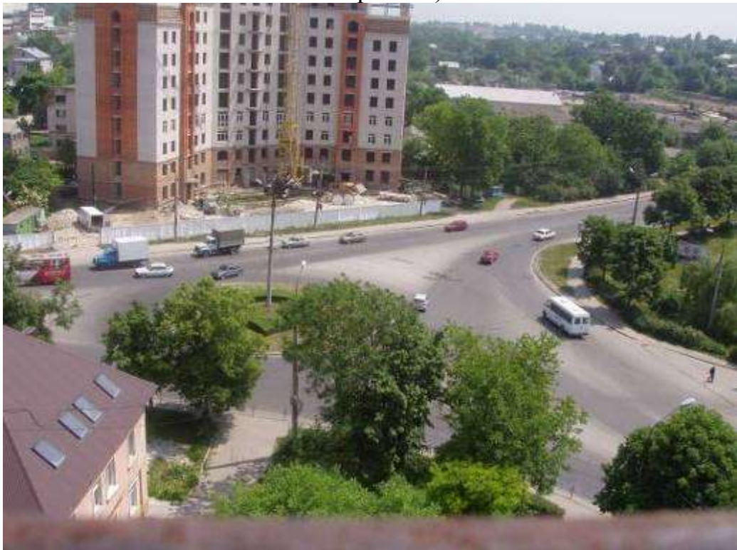
Транспортна розв'язка вулиць Микулинецька, Живова, Острозького, Замонастирська, Гайова у м. Тернопіль (стаціонарний пост спостереження за станом атмосферного повітря № 2)