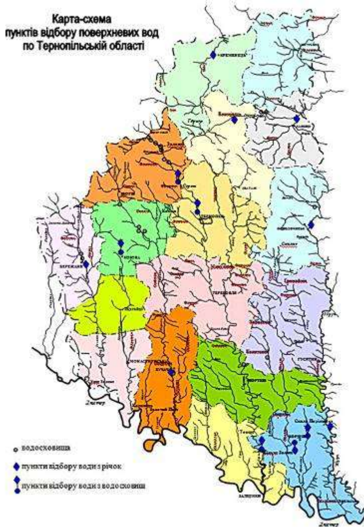
Таблиця 2. Гранично допустимі величини (ГДК) гідрохімічних показників

У табл. 2 наведено нормативи (ГДК) гідрохімічних показників, за якими здійснювалась оцінка.