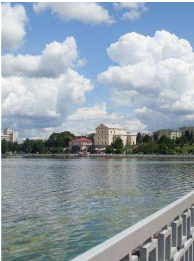
Мал. 2.2. Тернопільське водосховище

Касперівське водосховище, р. Серет – відноситься до категорії господарсько-побутового призначення.