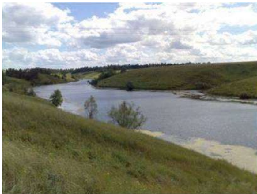
Мал.2.6. Річка Коропець

Контроль за станом р. Коропець протягом листопада не проводився.