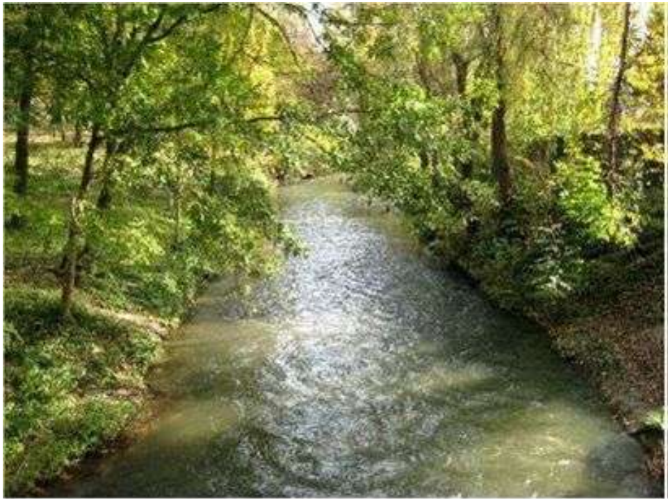
мал.2.7. Річка Золота Липа

Контроль за станом р. Золота Липа протягом листопада не проводився.